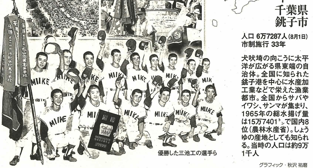
優勝した三池工の選手ら

福岡県 大牟田市 人口 12万1255人(8月1日) 市制施行 17年 県南端の自治体。石炭の発見は15世紀半ば。明治期に炭鉱町として発展し、国内最大とされた三井三池炭鉱(宮浦鉱、四山鉱、三川鉱)を抱える「炭都」だった。1965年の出炭量は467万9800トン。当時の人口は約19万4千人で、炭鉱の合理化で減少傾向にあった