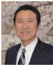
玉手山学園 理事長 関西福祉科学大学 学長