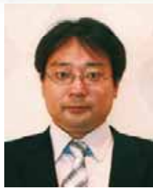
関西福祉科学大学同窓会 会長