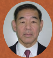
相谷 登 教授