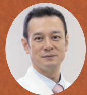
幸松 正敏 教授