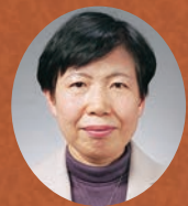
平田 まり 教授