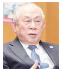
関西福祉科学大学 学長

新型コロナウイルスが変異を重ねることで、感染拡大が未だ終息しない状況ですが、同窓生の皆様、お元気で過ごしてはいかがでしょうか?いつも大学の研究・教育活動にご支援・協力くださり、誠に有り難うございます。