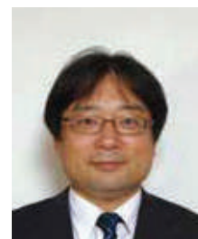
関西福祉科学大学同窓会 会長

同窓会の皆さまにおかれましては、コロナより本会の活動にご理解とご協力を賜り、誠にありがとうございます。収束の気配が見られないコロナウイルス感染症について、同窓生の中には、施設や病院の方にお勤めの方が多く、施設・院内で感染者の発生・対応で大変苦慮されているかと思えます。くれぐれも、皆様ご自愛ください。