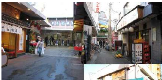
懐かしの石橋 2007年11月23日撮影