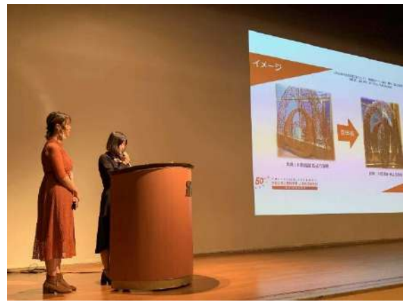
最優秀賞チームのプレゼンテーション