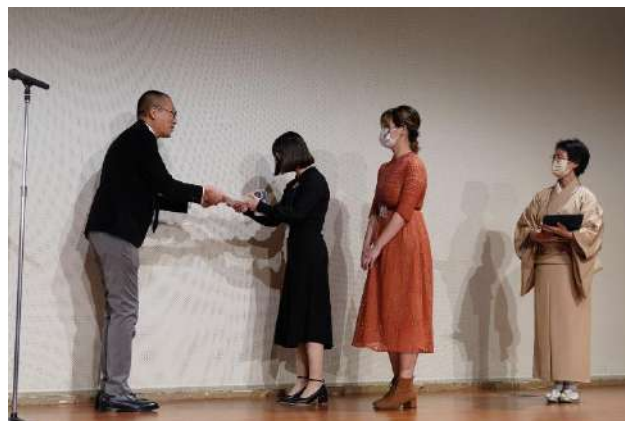
最優秀賞チームの表彰