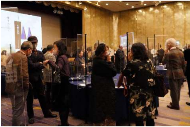
会場のあちこちで歓談の輪が...