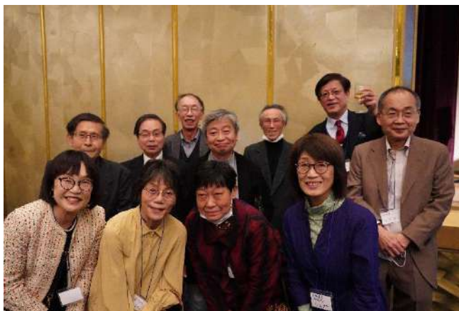
1期生の皆さん まだまだお若いです