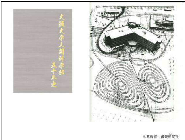
出来立ての「50年史」もお披露目されました