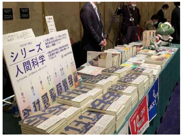
阪大出版会の展示販売 人科の先生方の著書がズラリ