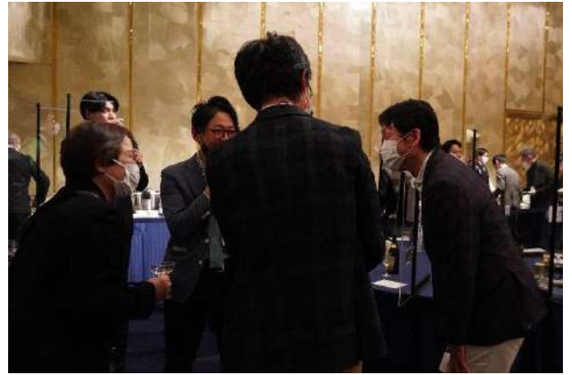
感染対策を徹底しながらの会食