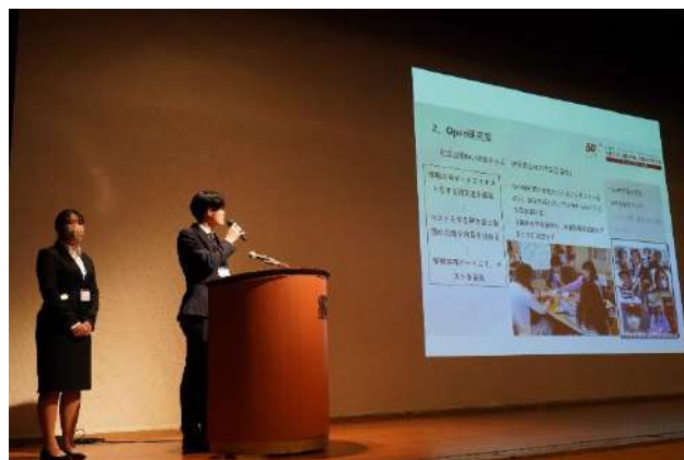
準優秀賞チームのプレゼンテーション