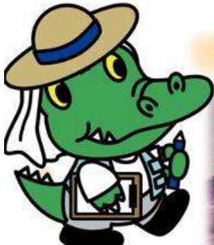
大阪大学公式マスコットキャラクター 「ワニ博士」人間科学部の魂