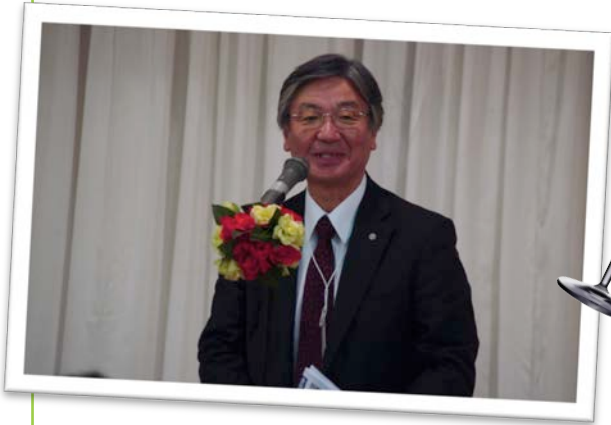
池ノ上学長による来賓挨拶