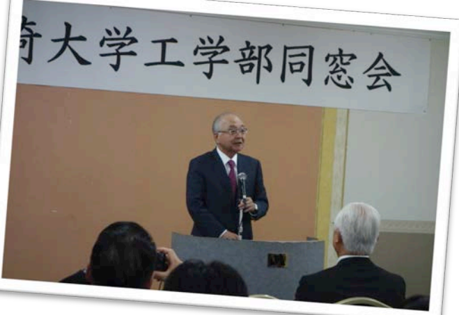
古賀様のご講演の様子