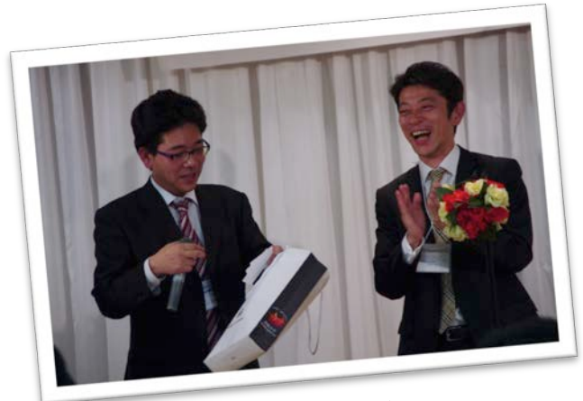
焼酎・お酒のプレゼントの抽選会

筆末となりましたが、この工学部同窓会の懇親会において、霧島酒造株式会社、雲海酒造株式会社、サントリースピリッツ株式会社より焼酎やお酒のご寄付を頂きました。この紙面をお借りして、感謝申し上げます。