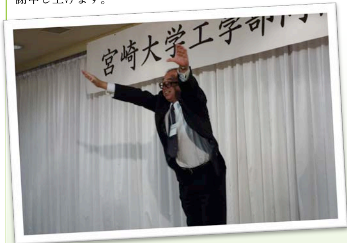
香月様によるエール