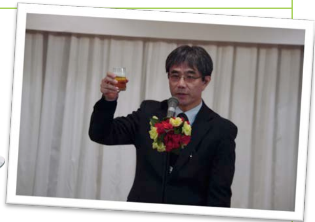
横田学部長による乾杯のご発声