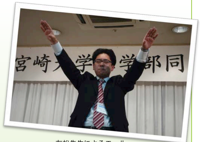
友松先生によるエール