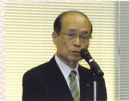
能美防災 橋爪会長 乾杯挨拶