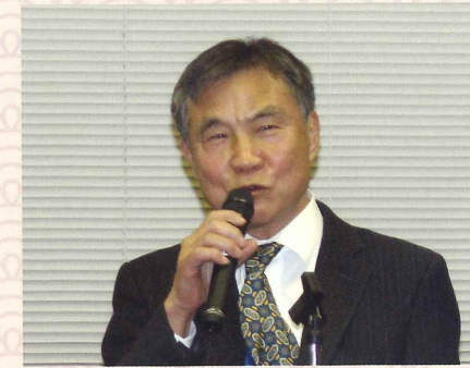
水沢副会長 中締め挨拶