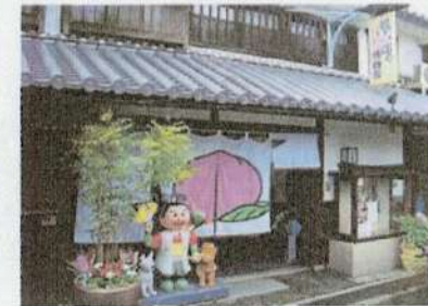
<桃太郎からくり博物館>