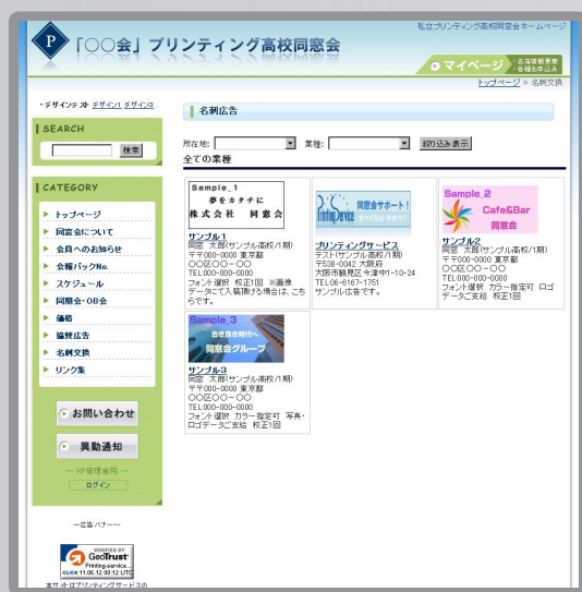
広告サンプルページ

同窓生の縁、絆を深めるとともに、同窓会広報活動の資金獲得のため、ぜひともご出稿をお願いいたします。