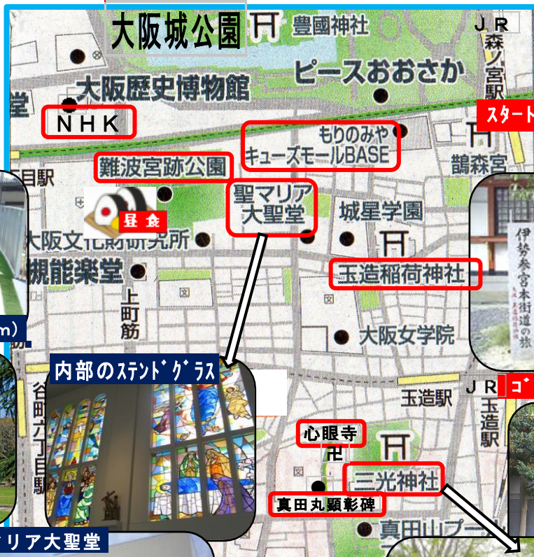
玉造稻荷神社 伊勢迄歩講起点碑