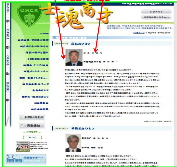
掲載記事閲覧画面