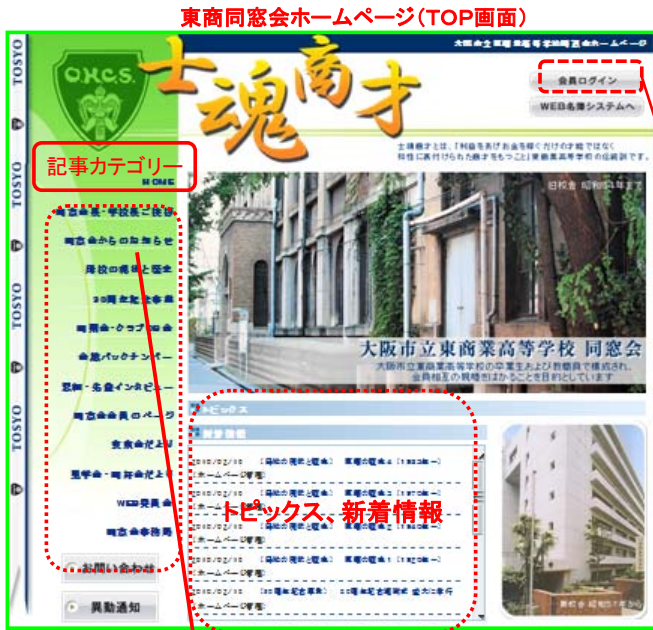
東商同窓会ホームページ(TOP画面)