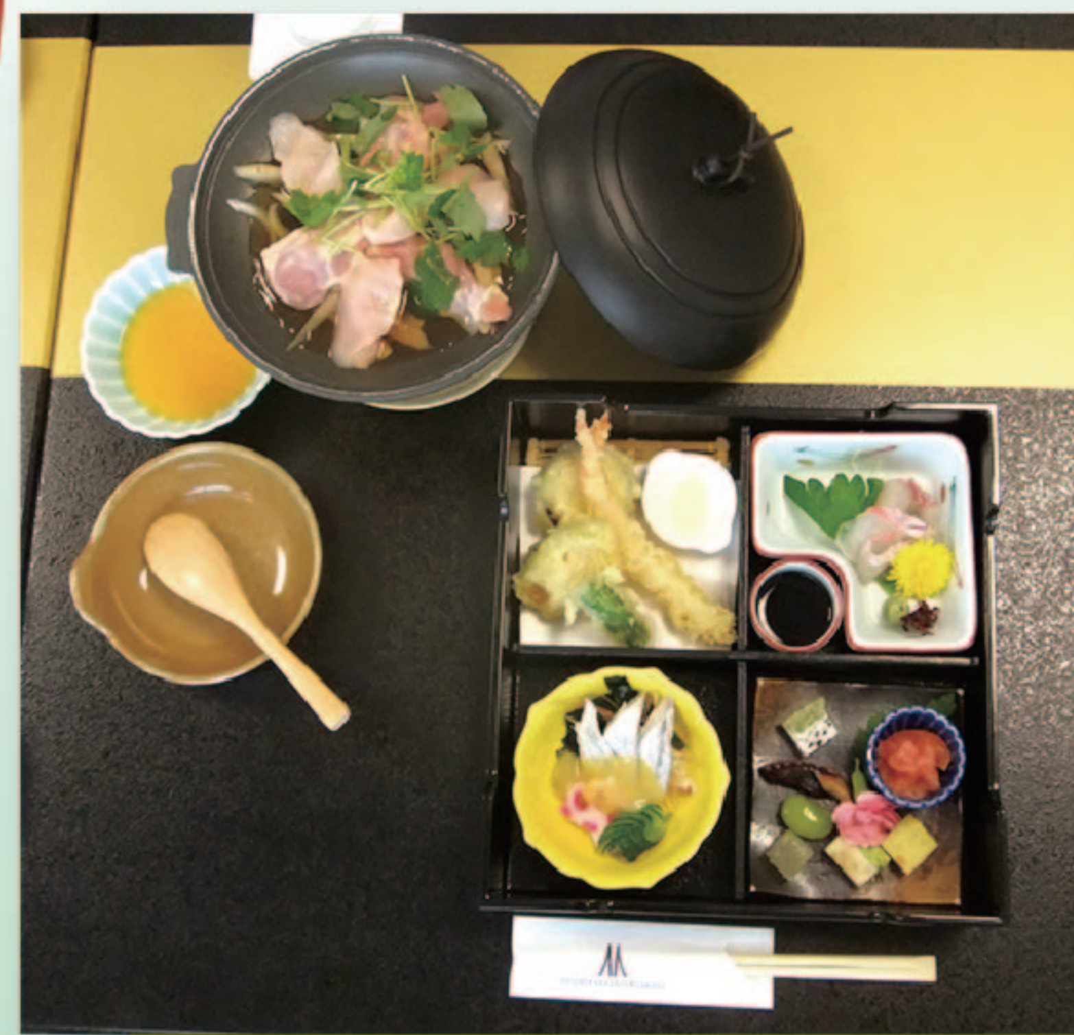
▲写真はイメージです。

※お願い… 乾杯用のお飲み物は当会で用意させていただきますが、追加のお飲み物は各自ご精算ください。