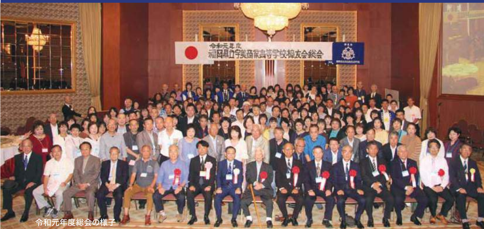
令和元年度総会の様子

「樟友会とは」…宇美商業の地元宇美八幡宮の御神木でもある樹齢二千年の樟の木と宇美商卒業の仲間たちが大いに発展するように…と想いを込めて命名された。